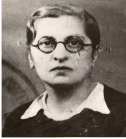
Halide Edip (Adivar)