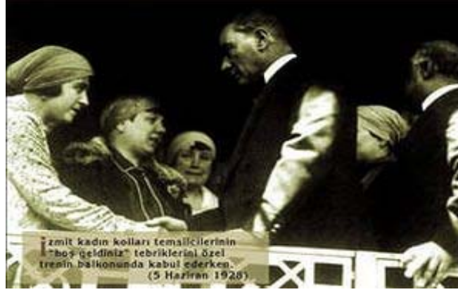
İzmir Kadın Kolları Temsilcileri ve Mustafa Kemal Atatürk (5 Haziran 1928)