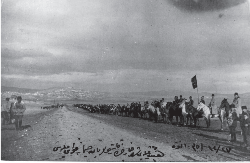
EK-1: “27/12/35 (27 Aralık 1919): Heyet-i Temsiliyeyi Şehir Haricinde Karşılamanın Haymana Kuva-yi Milliyesi”