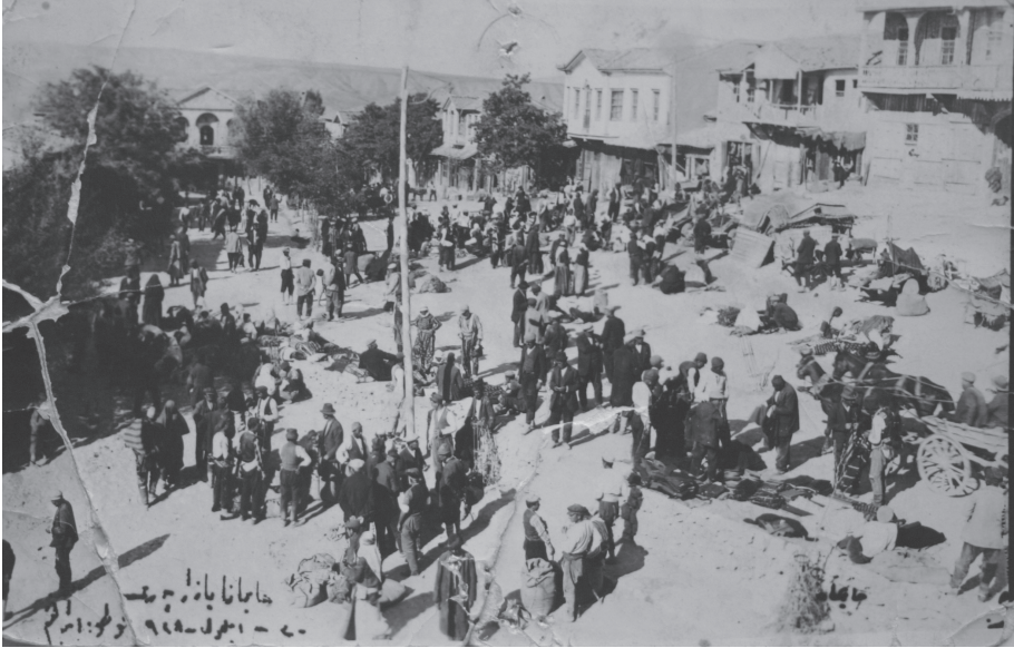
EK-4: “Haymana Pazar Yeri (20 Eylül 1928)”