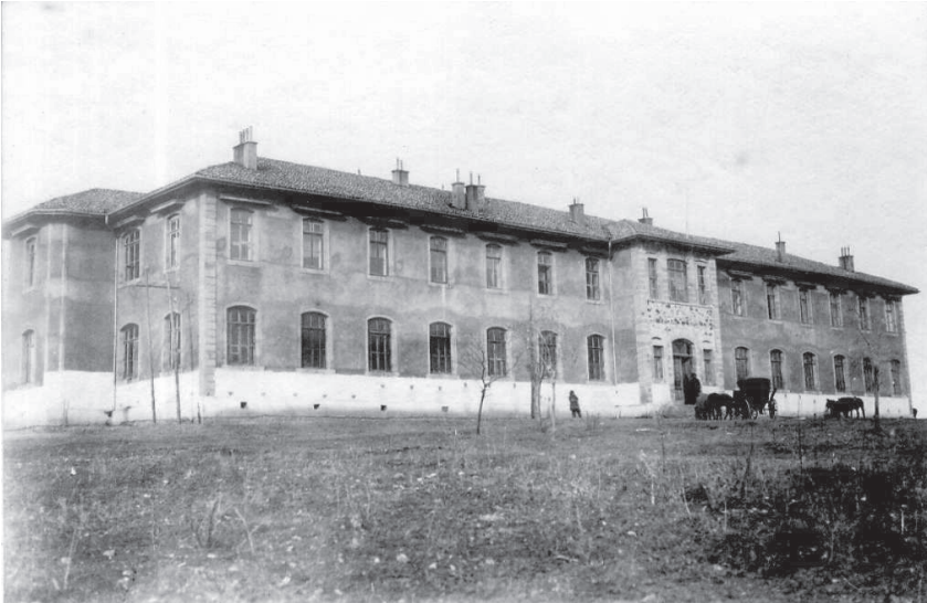
EK-2: “Ankara Ziraat Mektebi”