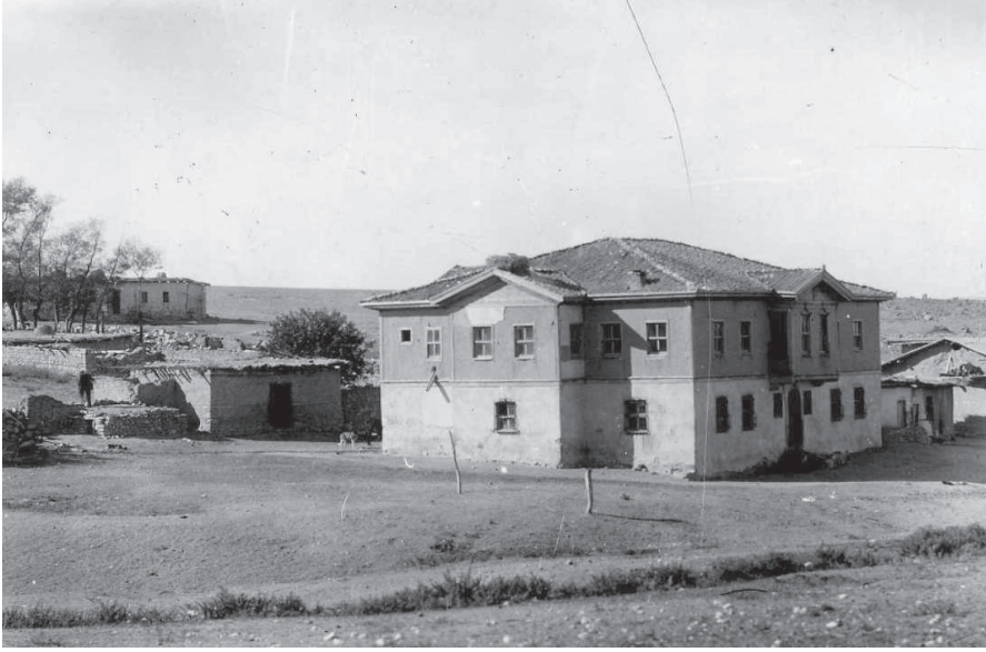
EK-5: "Polatlı-Alagöz Batı Cephesi Karargâhı"

Türk İnkılâp Tarihi Enstitüsü Arşivi, FK. 34, G. 12, B. 12 001.