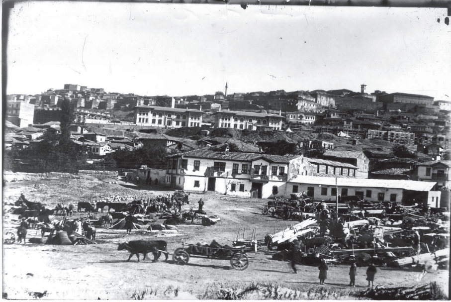
EK-3: Türk İnkılâp Tarihi Enstitüsü Arşivi , FK. 32, G. 19, B. 19 001.