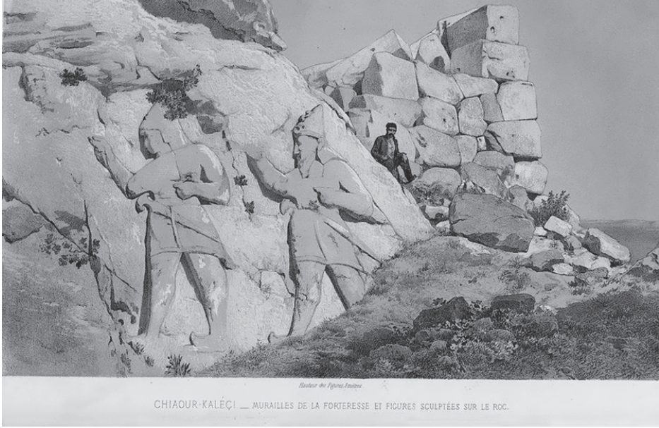
Resim 2: Gavurkale Hitit kabartması. (Perrot, G., Guillaume, E., Delbet, J., 1872, Exploration Archeologique de la Galatie et de La Bithynie D'une Partie de la Mysie De la Phrygie, de la Cappadoce et du Pont, Paris: Taf.10)