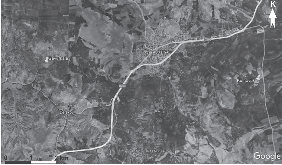
Resim 1: Gavurkale ve Külhöyük'ün konumu.