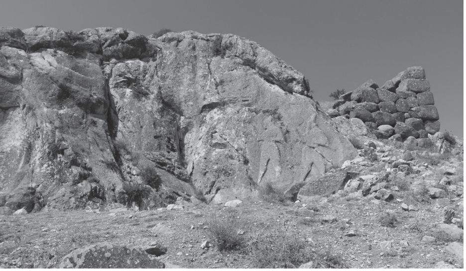
Resim 3: Gavurkale Hitit kabartması.