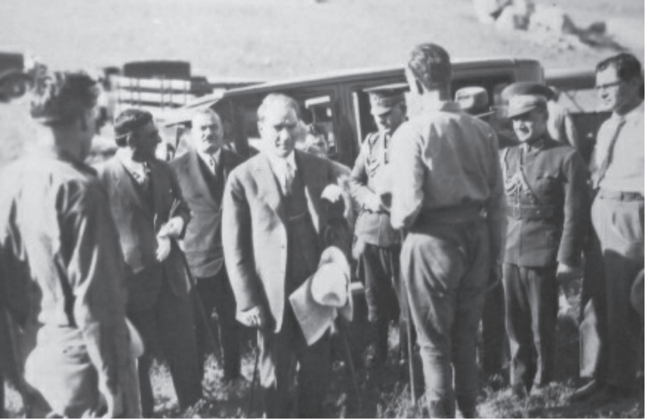
Resim 4: Atatürk Gavurkale'de.